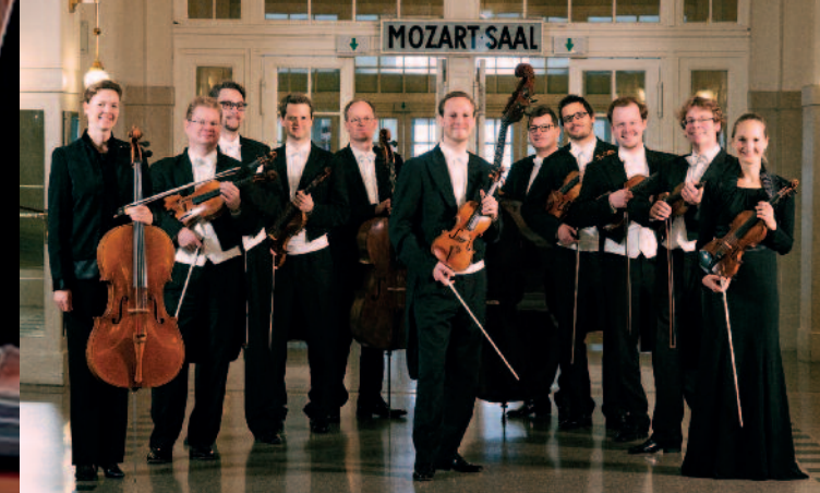
Das berühmte Ensemble der Wiener Streichersolisten besteht aus Mitgliedern der Wiener Philharmoniker und der Wiener Symphoniker.